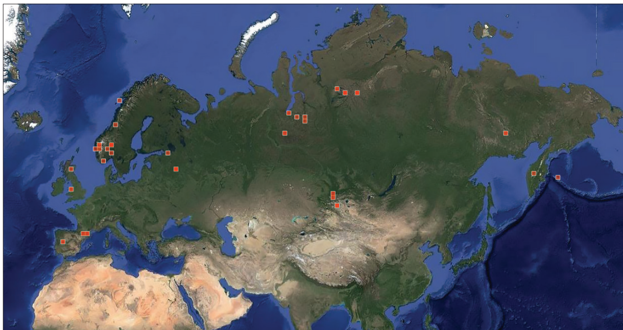
Рис. 2. Сучасні спостереження Subularia aquatica в Євразії (iNaturalist, accessed 8 November 2024)