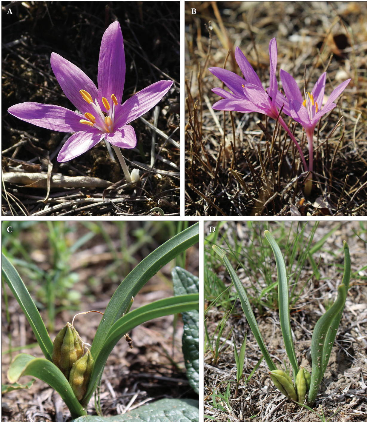
Рис. 2. Colchicum fominii . А, В: квітучі рослини (26 вересня 2020 року); С, D: рослини з листками і плодами (12 травня 2021 року)