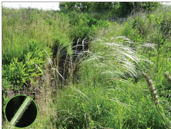
Рис. 5. Stipa dasyphylla на верхівці пагорбу біля с. Старі Безрадичі в Обухівському районі

Tragus racemosus (L.) All. ( Poaceae ): неофіт, ксенофіт, колонофіт; п. ареал: субсередземноморський. — ЛП. — Київ : вул. Колекторна, рудеральна піщана ділянка біля Бортницької станції аерації, численно, 50.39657° N, 30.675166° E, 01.08.2022, Давидов, А.О. Давидова (KW162978; https://www.inaturalist.org/observations/129424462 ). — ПЛС. — Київська обл. : Обухівський р-н, селище Козин, узбіччя шосе, 50.1843° N, 30.7368° E, 07.08.2018, Шиндер (KWHA103696); селище Козин, узбіччя вул. Старокиївська, садове товариство "Нескучне", 50.2222° N, 30.6960° E, 07.08.2018, Шиндер (KWHA103695); м. Українка, на піщаному узбіччі дороги, 50.15314° N, 30.74373° E, 25.07.2020,