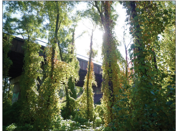
Рис. 10. Колонія Vitis riparia у вертикальному ярусі заплавної деревостану на Оболоні, м. Київ

Veronica triphyllos L. (Plantaginaceae): археофіт, ксенофіт; п. ареал: виходячи із особливостей хорології виду, імовірно субсередземноморський (Zajac, 1979; POWO, 2022–onward). — ПЛС. — Київ: Теличка, на узбіччі заїзду з Наддніпрянського шосе на міст Патона, 50.424895° N, 30.565132° E; 14.04.2018, Шиндер (KWNA102803); там само, 15.04.2021, Шиндер ( https://www.inaturalist.org/observations/105494673 ). — Київська обл.: Обухівський р-н, сх. окоп. с. Нещерів, на піщаному лузі, 50.153718° N, 30.629807° E, 23.04.2018, Шиндер (KW s.n.).