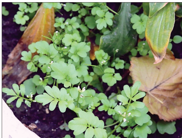
Рис. 2. Cardamine occulta у квітковому вазоні на вулиці Терещенківській у м. Київ

Equisetum × moorei Newman (Equisetaceae): рідкісний гібрид аборигенного E. hyemale L. і чужорідного для Київщини E. ramosissimum Desf., неофіт, ксенофіт. — ПЛС. — Київ: НПП "Голосіївський", на осоковому болоті на березі озера Шапарня поруч із залізницею, 50.262368° N, 30.571964° E, 03.06.2016, Давидов, В.Ю. Березовська, Є.В. Польовий (KW162976; https://www.inaturalist.org/observations/148342272 ).