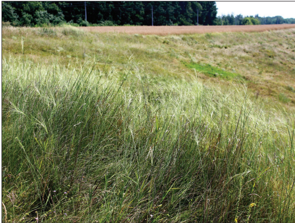
Рис. 9. Степове угруповання Stipa capillata в околиці с. Малі Дмитровичі Обухівського району (фото І. Ольшанського, 2021)

Fig. 9. Stipa capillata in steppe communities near the village of Mali Dmytrovychi, Obukhiv District (photo by I. Olshanskyi, 2021)