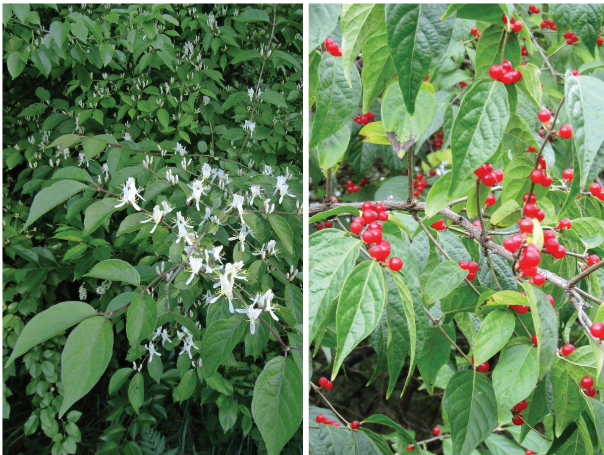
Рис. 3. Lonicera maackii в насадженнях Національного ботанічного саду імені М.М. Гришка, м. Київ