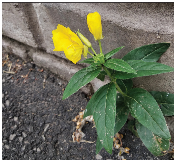
Рис. 4. Oenothera pilosella у м. Київ

Lolium × elongatum (Ehrh.) Banfi, Galasso, Foggi, Kopecký & Ardenghi [= L. perenne × L. pratense (Huds.) Darbysh., × Schedolium loliaceum (Huds.) Holub] (Poaceae): аборигенний нотовид з європейським ареалом. — ПП. — Київ: Сирецький дендропарк, заплава р. Сирець, нерідко разом з батьківськими видами, 50.482403° N, 30.433946° E, 23.07.2014, Давидов (KW162984); Протасів Яр, група на газоні біля дороги, 50.426143° N, 30.502567° E, 01.06.2021, Левон ( https://www.inaturalist.org/observations/81224109 ); урочище "Совки", на газоні біля проспекту Лобановського, численна група, 50.408043° N, 30.498906° E, 19.06.2022, Левон ( https://www.inaturalist.org/observations/122666576 ).