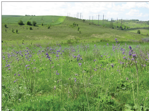
Рис. 8. Степова рослинність із Salvia nutans біля с. Дерев'яна Обухівського району (фото О. Шиндера, 2019)