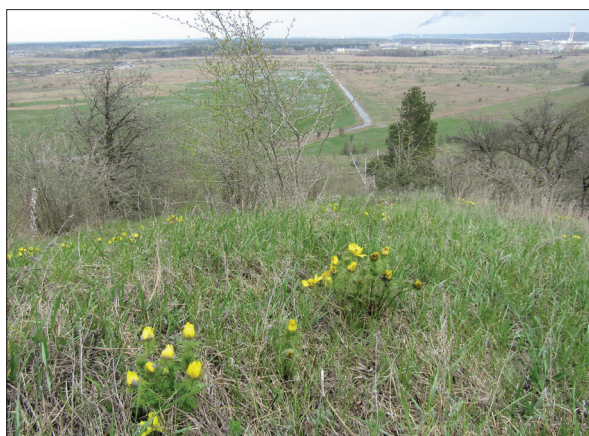
Рис. 6. Степова рослинність з участю Adonis vernalis на околиці м. Обухів (фото О. Шиндера, 2023)

Fig. 5. Stipa dasyphylla on the hilltop near Stari Bezradychi village, Obukhiv District (photo by O. Shynder, 2023)