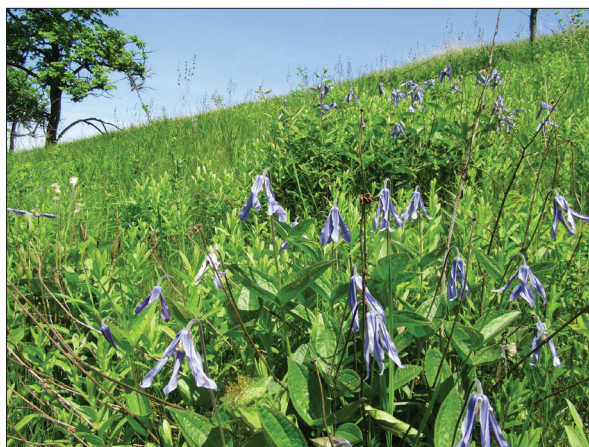
Рис. 7. Clematis integrifolia в околицях с. Копачів Обухівського району

Clematis integrifolia L. (Ranunculaceae): рідкісний аборигенний північностеповий вид на північній межі поширення. — ПЛС. — Київська обл.: Обухівський р-н, с. Копачів — під-зх. окол., балка Верем'я, схил зх. експ., 50.12014° N, 30.44836° E, 18.05.2019, Шиндер, С. Старошук,