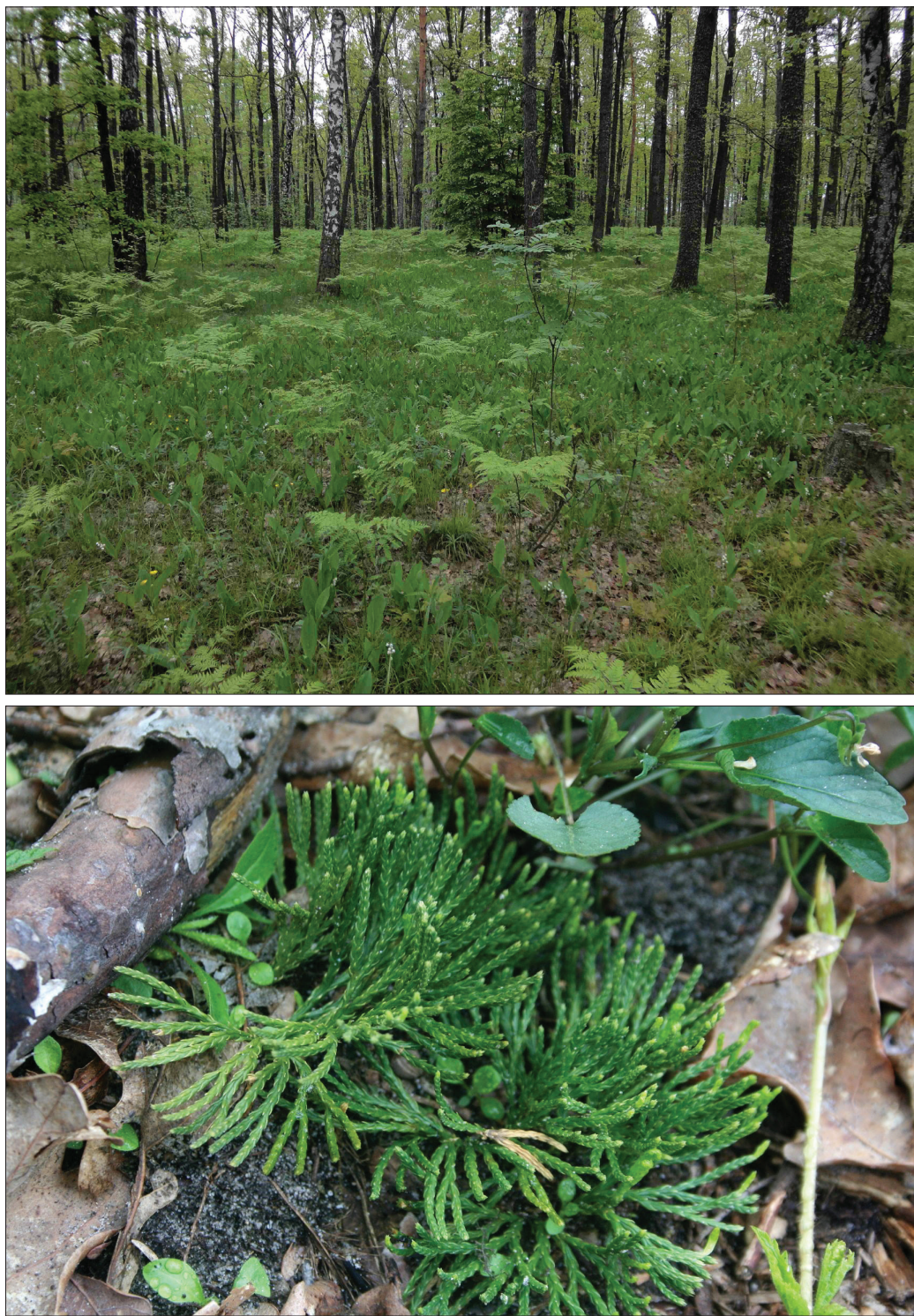
Рис. 3. Diphasiastrum tristachyum у Луб'янському лісництві (Київське Полісся). А: місцезростання; В: локальна популяція