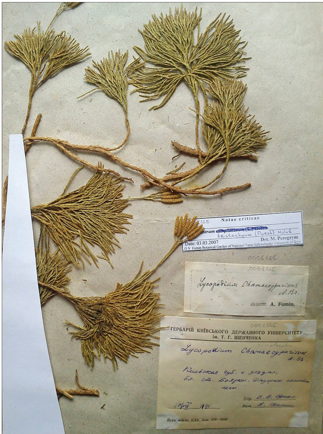
Рис. 2. Гербарний зразок Diphasiastrum tristachyum (KWU0001665)