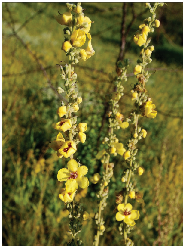
Рис. 3. Salvia nutans (зліва) і Verbascum chaixii subsp. orientale (справа) на степових ділянках у Бердичівському районі Fig. 3. Salvia nutans (on the left) and Verbascum chaixii subsp. orientale (on the right) on the steppe plots in Berdychiv District