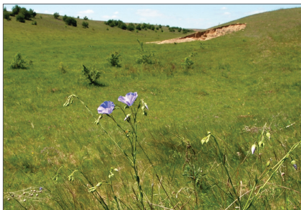
Рис. 4. Linum perenne у степовій балці Королиха біля с. Карабчіїв

Fig. 4. Linum perenne in the steppe gully Korolykha near Karabchiv village