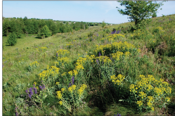
Рис. 2. Степовий схил з Euphorbia stepposa в околиці с. Ягнятин

Житомирський лісостеп характеризується досить типовими природними умовами для північної смуги лісостепової зони України. Природні біотопи займають близько 12% її площі, решта представлена антропогенними біотопами. У складі природної рослинності найбільш представлені лісові неморальні та суборові фітоценози; лучні, псамофітно-лучні, степові, болотні, прибережно-водні та водні фітоценози, поширені в регіоні на незначних площах. У складі антропогенних рослинних угруповань переважають агрофітоценози, представлені переважно посівами зернових, зернобобових, олійних і технічних культур, а також сіяними луками та садами. Таким чином, у Лісостепу, де в доагрикультурний період ділянки лісової рослинності на високих плакорах чергувалися переважно з ділянками лучних степів на пласких вирівняних плакорах та похилих схилах плакорів, балок та річкових долин, нині, за влучним висловом Ф.М. Мількова (Milkov, 1977), досліджувана зона має характер "лісополя", де, як правило, невеликі за площею лісові масиви збереглися на найбільш підвищених розчленованих ерозією плакорів, які чергуються зі значно більшими ділянками розораних сільськогосподарських угідь, представлених переважно полями. Натомість, дуже незначні за площею залишки степової рослинності збереглися в регіоні виключно на невіддях — крутих схилах річкових долин і балок. Це є загальною закономірністю для Лісостепу (Kirikov, 1979). Слід