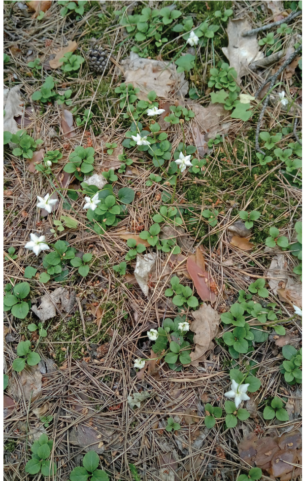
Рис. 3. Moneses uniflora в сосновому лісі на Лівобережному Поліссі (Краснянське лісництво, Чернігівська обл.)