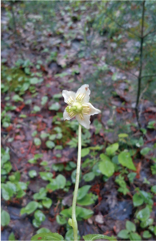
Рис. 2. Moneses uniflora в березово-сосновому лісі в Центральному Поліссі (Глиннівське лісництво, Рівненська обл.)