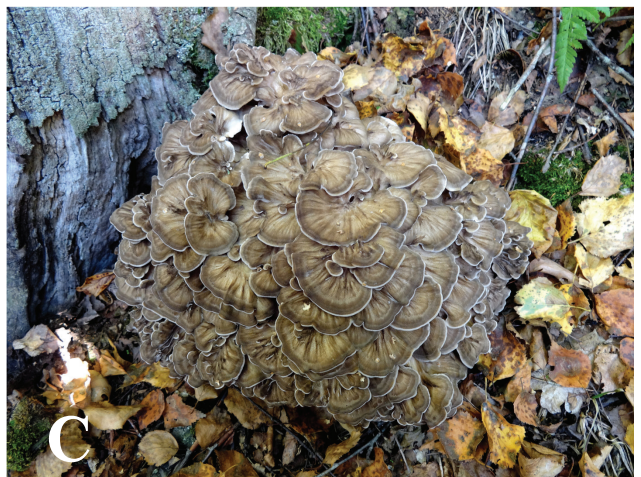
Fig. 1. Grifola frondosa . A: registration of parameters of two fruit bodies found at the base of an oak trunk; B, C: fruit bodies of the fungus