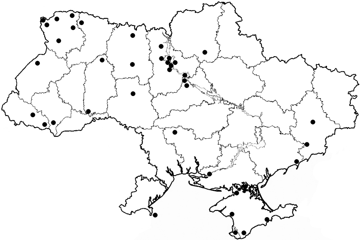
Рис. 2. Карта-схема розміщення на території України локалітетів, з яких ізолювано 299 штамів водоростей IBASU-A Fig. 2. Schematic map of the localities in Ukraine from which 299 strains of IBASU-A were isolated

Усі культури ідентифіковано співробітниками відділу фікології. Описи властивостей більшості штамів наведено у низці монографій та статей (Massjuk, 1971, 1973a–c; Massjuk et al., 2007; Borisova, Tsarenko, 2002; Hegewald et al., 1998, 2005; Mikhailyuk et al., 2003, 2011, 2013; Tsarenko et al., 1996a,b, 2005). Фонди IBASU-A регулярно поповнюються новими ізолятами, але, нажаль, збільшення одиниць зберігання лімітовано кількістю приміщень, обладнанням для зберігання та кількістю обслуговуючого персоналу. Також недосяжним є запровадження новітніх методів криоконсервації та молекулярної філогенії, що стримує процес депонування штамів сторонніми організаціями і унеможливує роботу зі штамми на сучасному рівні. Сподіваємось, що подальше цільове фінансування колекції IBASU-A як об'єкта національного надбання України сприятиме поліпшенню її діяльності.