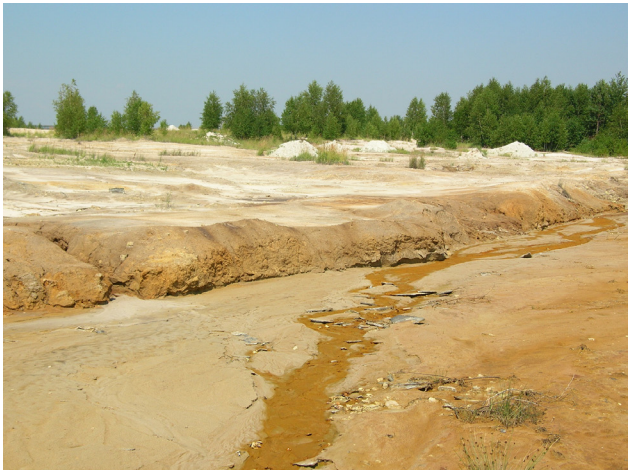
Рис. 1. Територія, де здійснюється підземна виплавка сірки (загальний вигляд)