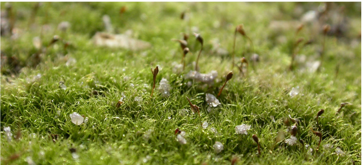
Рис. 2. Ділянки здійснення підземної виплавки сірки, вкриті Dicranella cerviculata Fig. 2. The areas over underground sulfur melting covered with Dicranella cerviculata