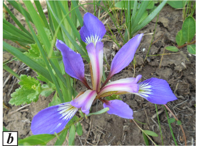
Рис. 1. Iris pontica : a — загальний вигляд середньовікової куртини; b — квітка Fig. 1. Iris pontica : a — general view of the middle-age clump; b —flower

районуванням України — до Південнокодринського округу пухнасто- та звичайнодубових лісів і різнотравно-злакових степів Лісостепової підобласті (зони) Степової зони України, який збігається з Волинсько-Подільською геоморфологічною областю пластово-денудаційних височин. Локалітет біля Болграда виявлений у межах Саратського округу різнотравно-злакових степів Степової підобласті (зони) Степової зони у Причорноморській області пластово-акумулятивних і пластово-денудаційних низовин (Natsionalnyi..., 2009). Із 33 локалітетів I. pontica (Shynder, Kozug, 2010) лише близько 80 % підтверджено гербарними зразками.