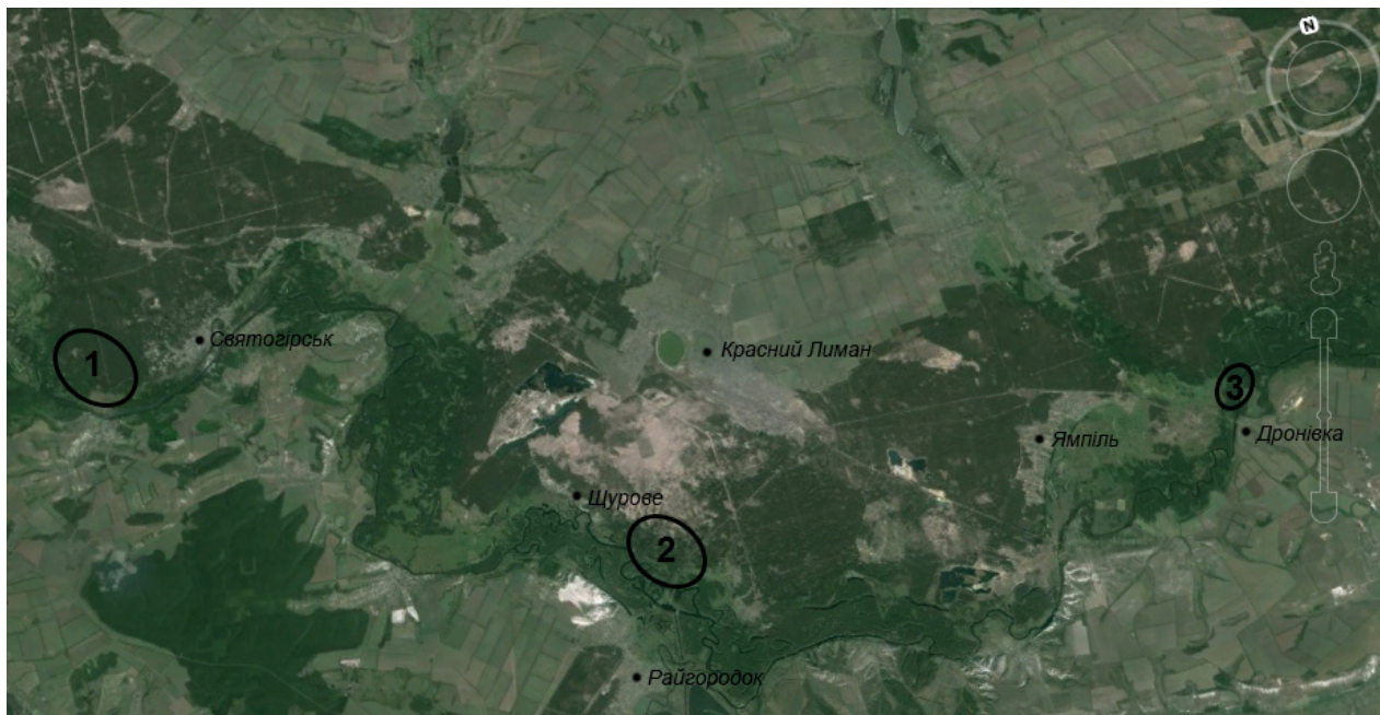
Рис. 1. Місця збирання базидіокарпів Schizophyllum commune на півночі Донецької області Fig. 1. Collection sites of the basidiocarps of Schizophyllum commune in the north of Donetsk Region

культур — 21, а монокаріотичних, отриманих із базидіокарпів, більше 180.