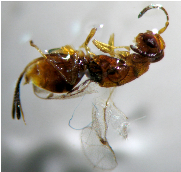
Рис. 4. Шкідник ялівців роду Megastigmus