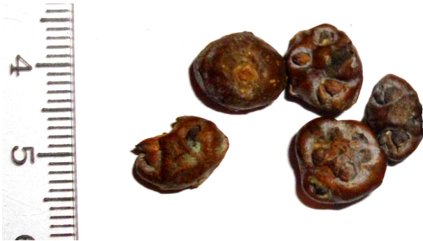
Рис. 3. Шишкоягоди J. chinensis із пошкодженим насінням