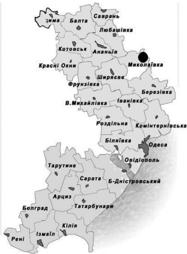
Рис. 1. Виявлене місцезростання Pulsatilla grandis в Одеській області