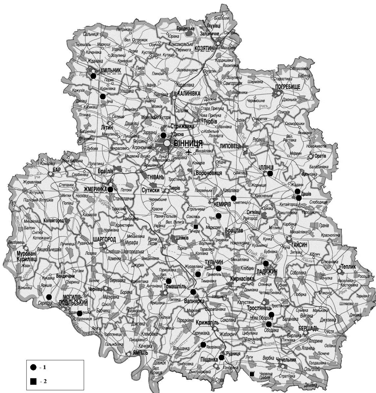
Рис. 1. Картохема поширення Scopolia carniolica у Вінницькій обл. У мовні позначення: 1 — відомі місцезнаходження; 2 — нові місцезнаходження